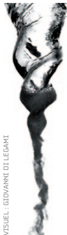
VISUEL : GIOVANNI DI LEGAMI

Entrée gratuite - Invitation à retirer au CRR ou au Musée de la Cour d'Or à partir du lundi 21 mai 2012