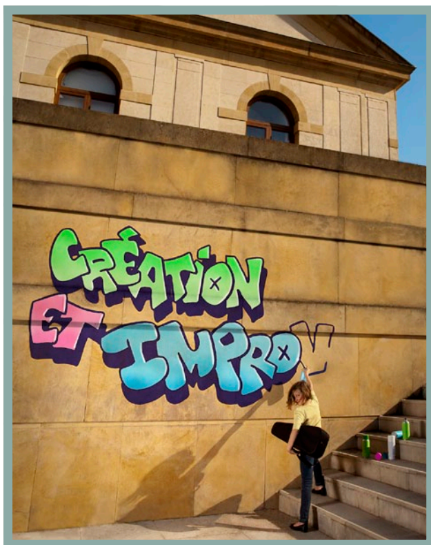
VISUEL : ARNAUD HUSSENOT / FABIEN DARLEY

Entrée gratuite - Billets à retirer dans le hall de l'Arsenal à partir du mercredi 9 mai 2012 dès 11h